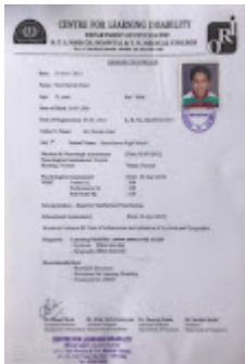
LD CERTIFICATE .jpg 325K